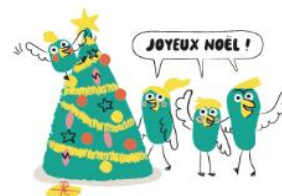
Illustration : © Mylène Rigaudie

OFFREZ A VOS ENFANTS LE PLAISIR DE LIRE !